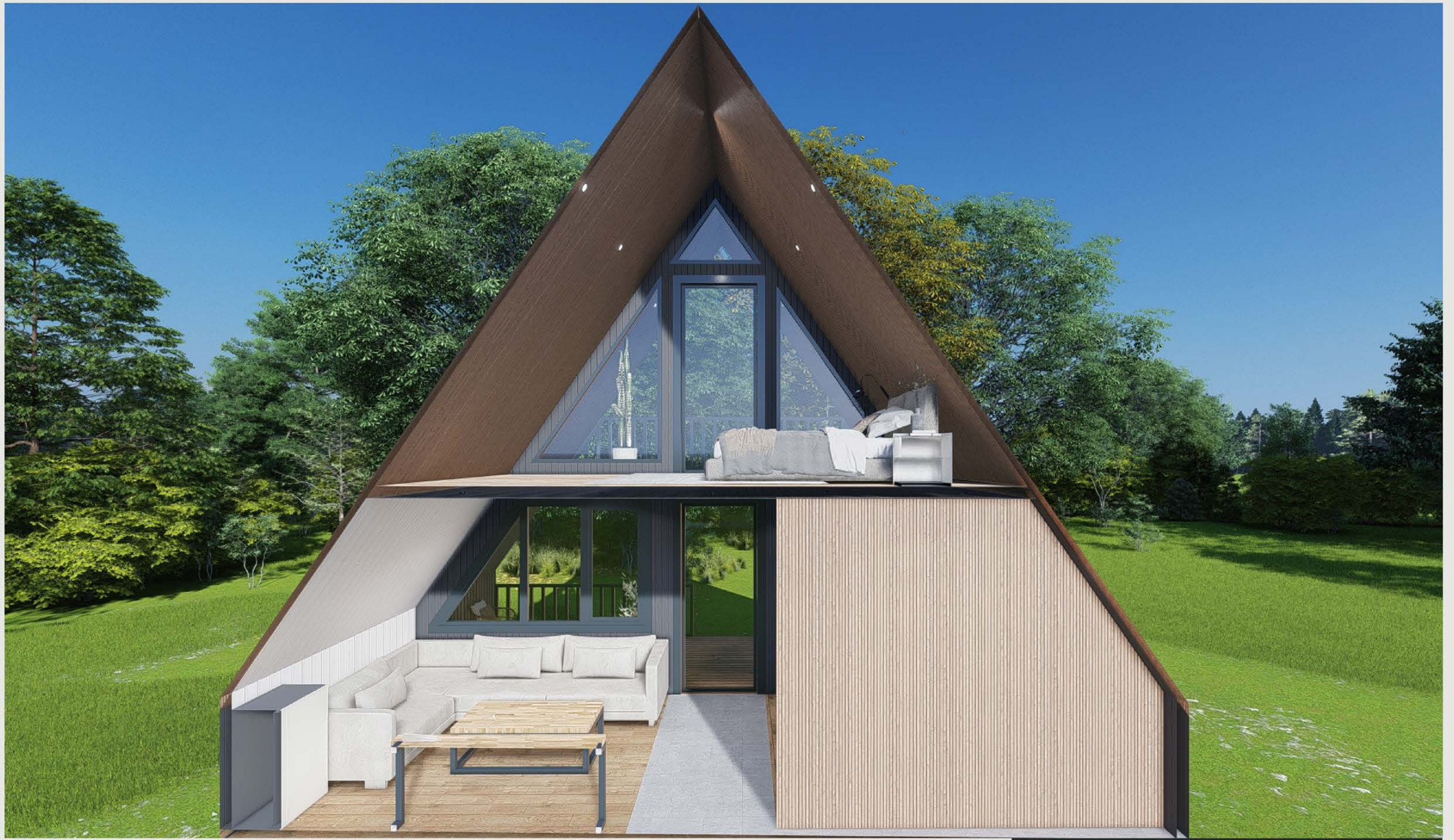
KESİT - 02