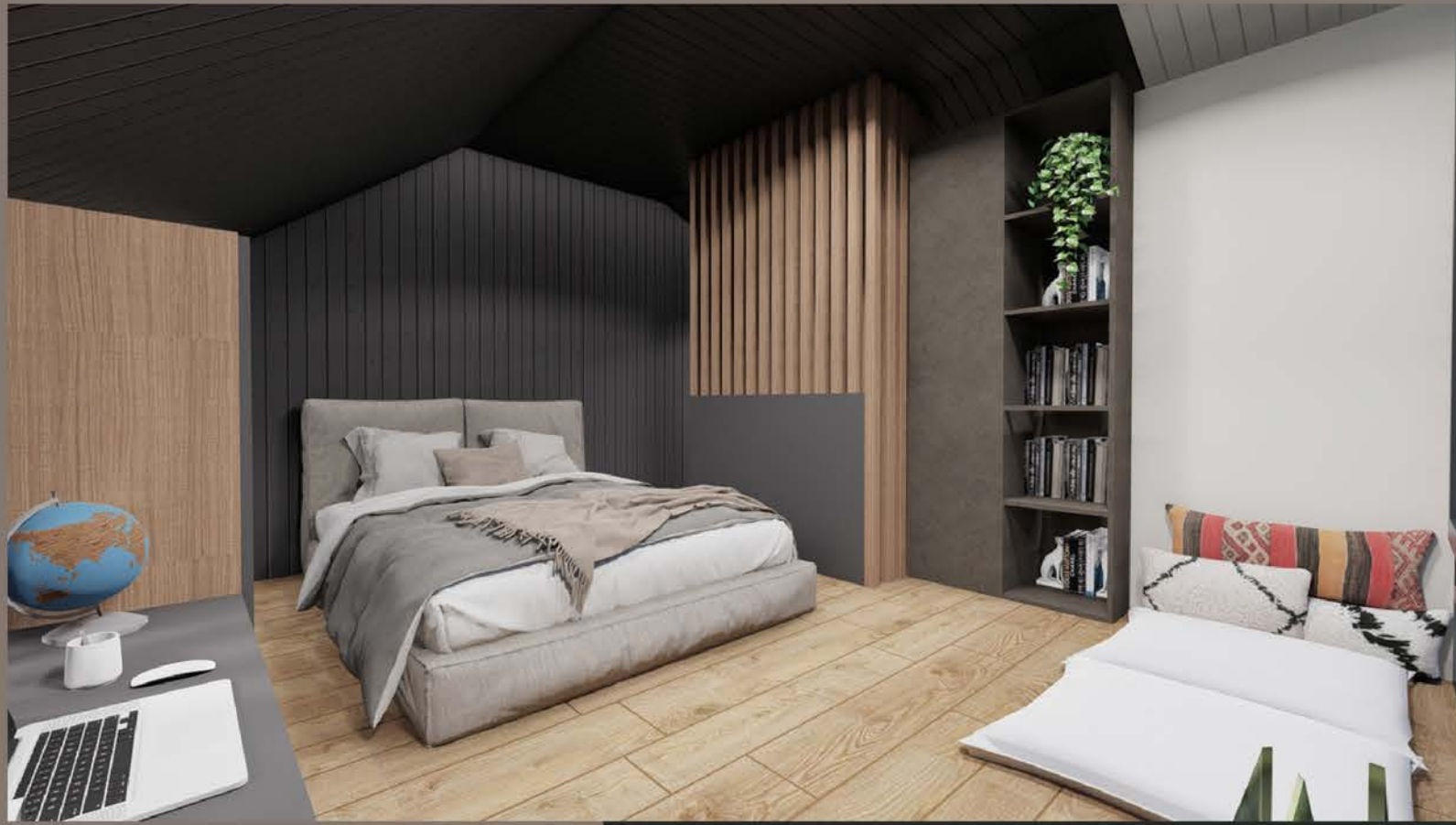
LOFT YATAK ODASI - 01