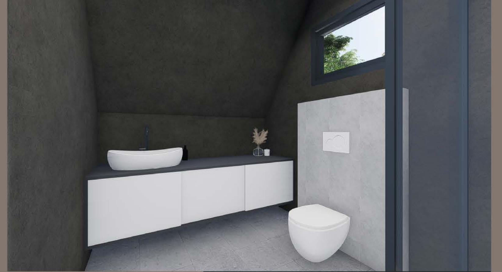
İÇ MEKAN GÖRSELLERİ