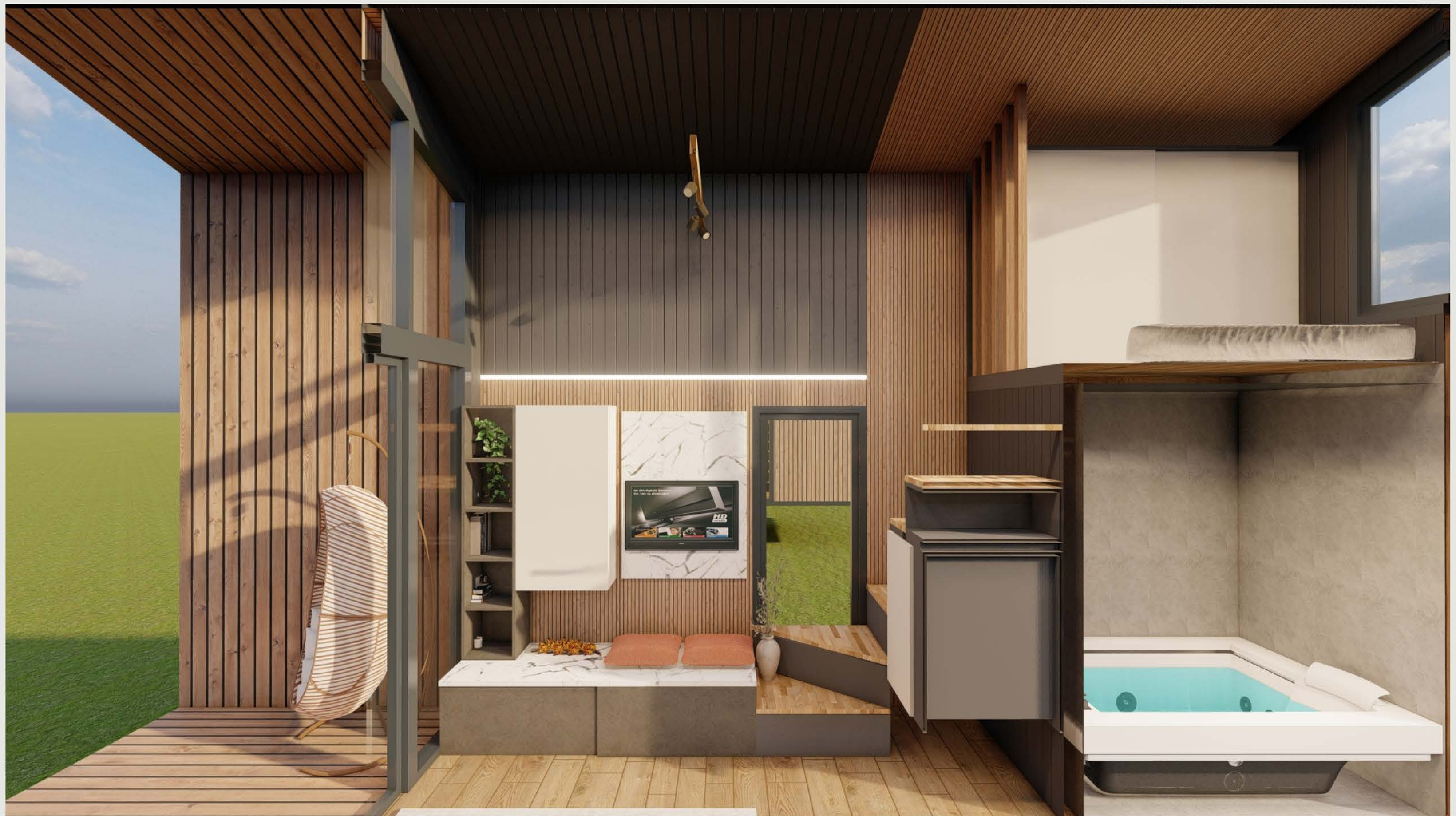
KESİT - 01