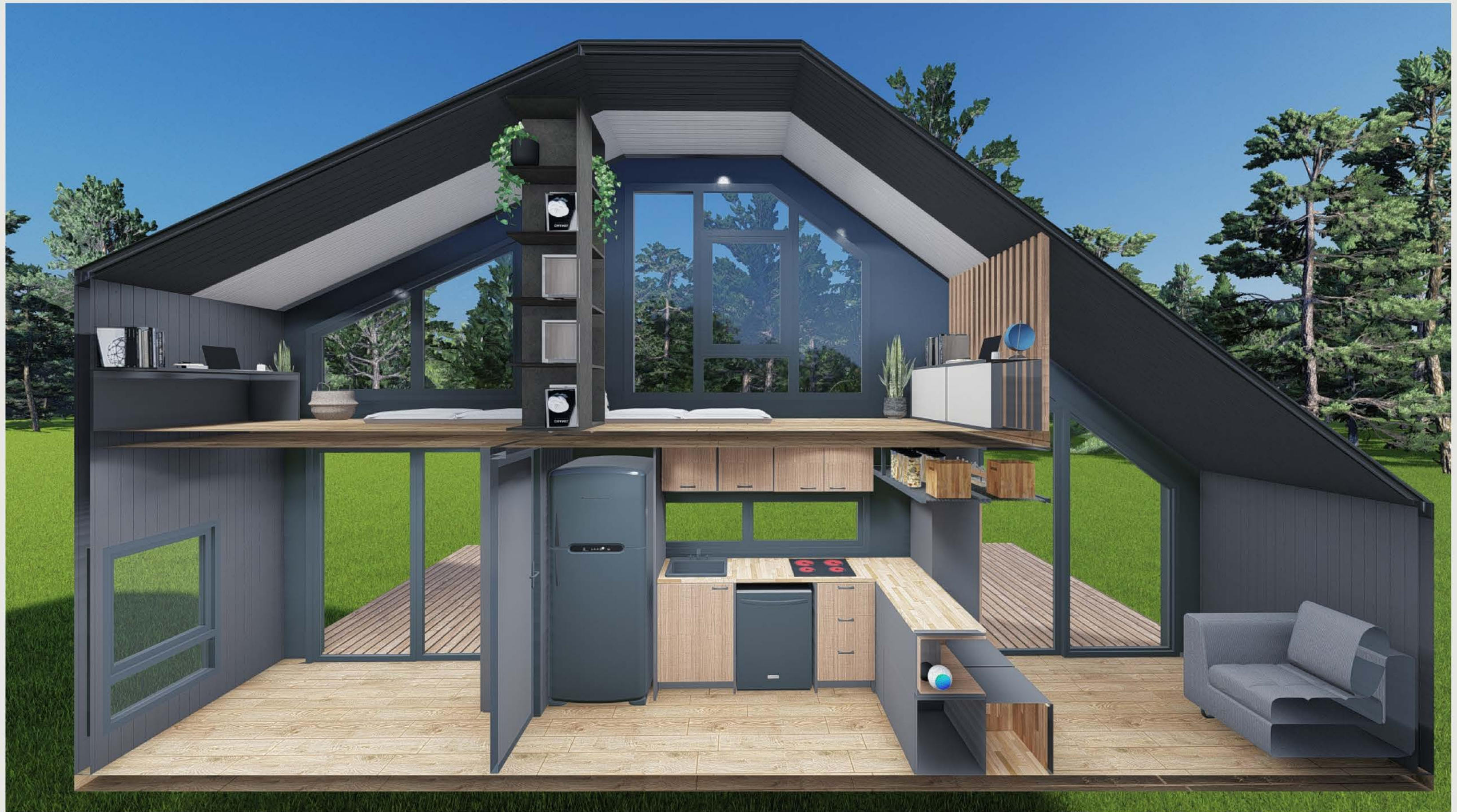
KESİT - 02