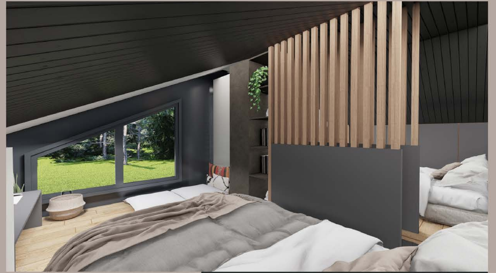
LOFT YATAK ODASI - 02