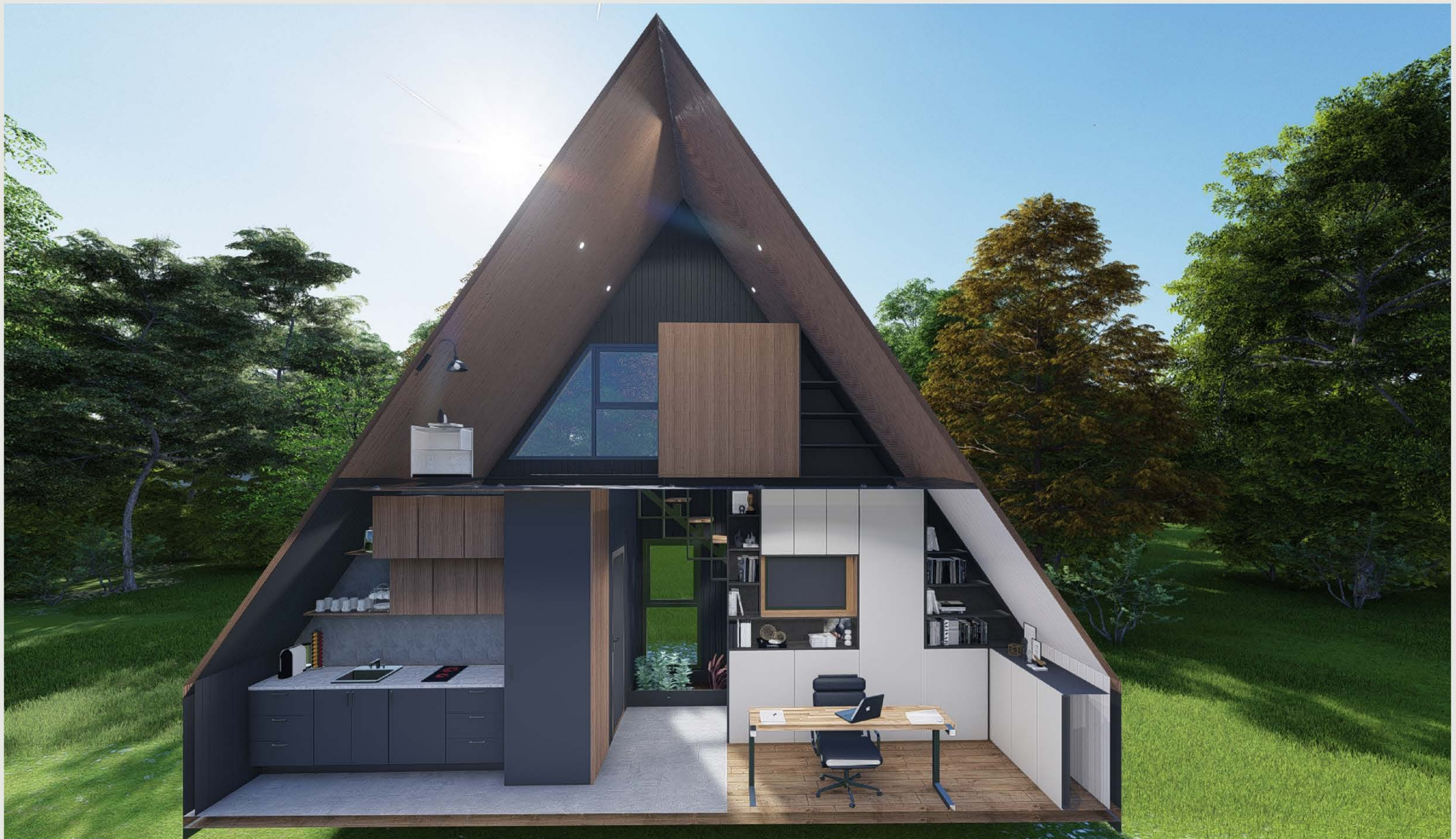
KESİT - 01