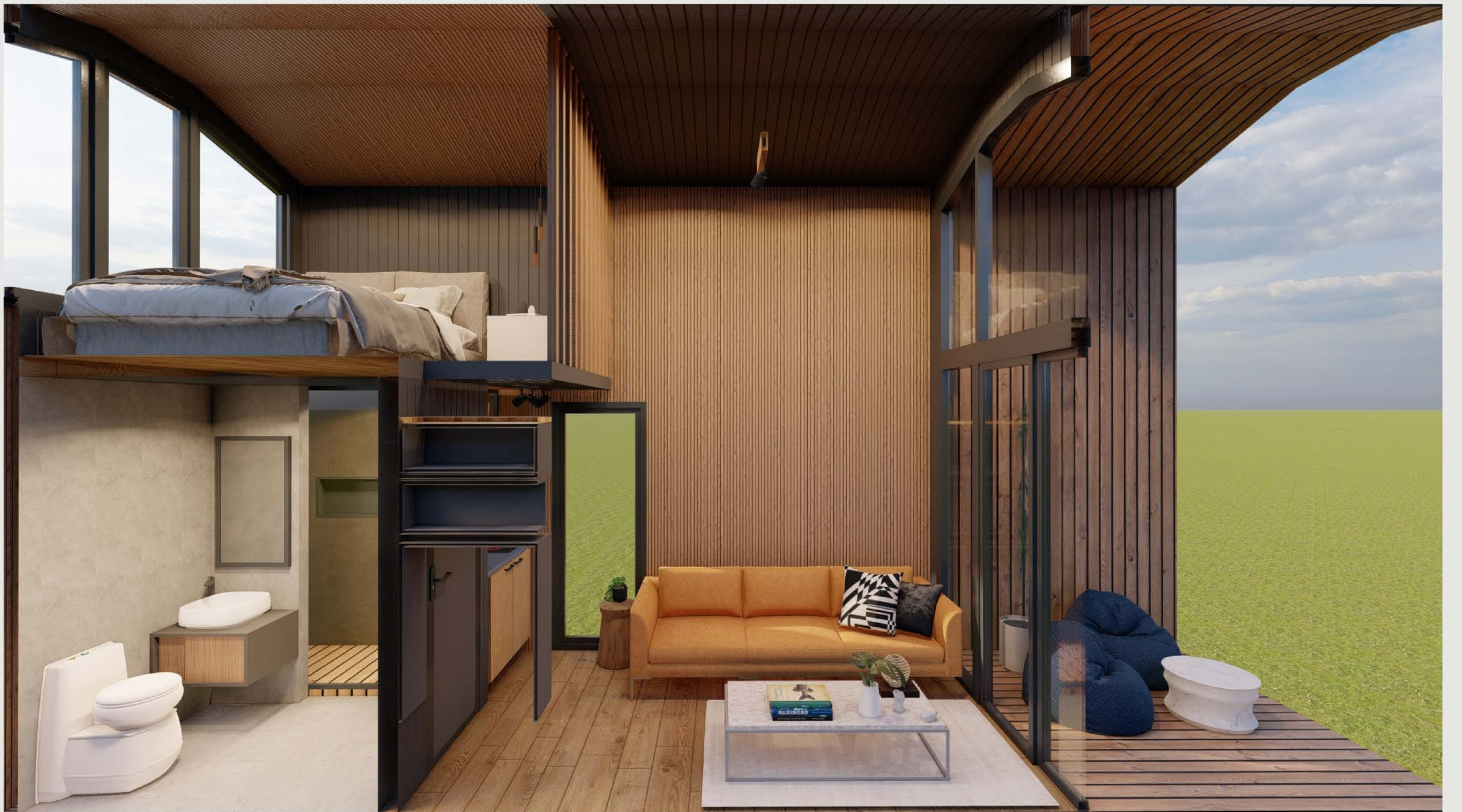
KESİT - 02