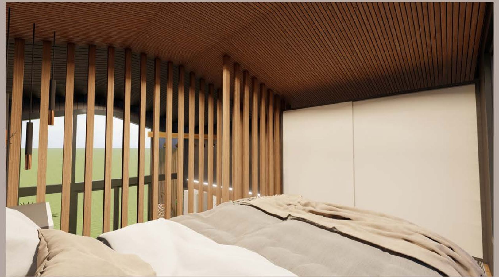
LOFT YATAK ODASI