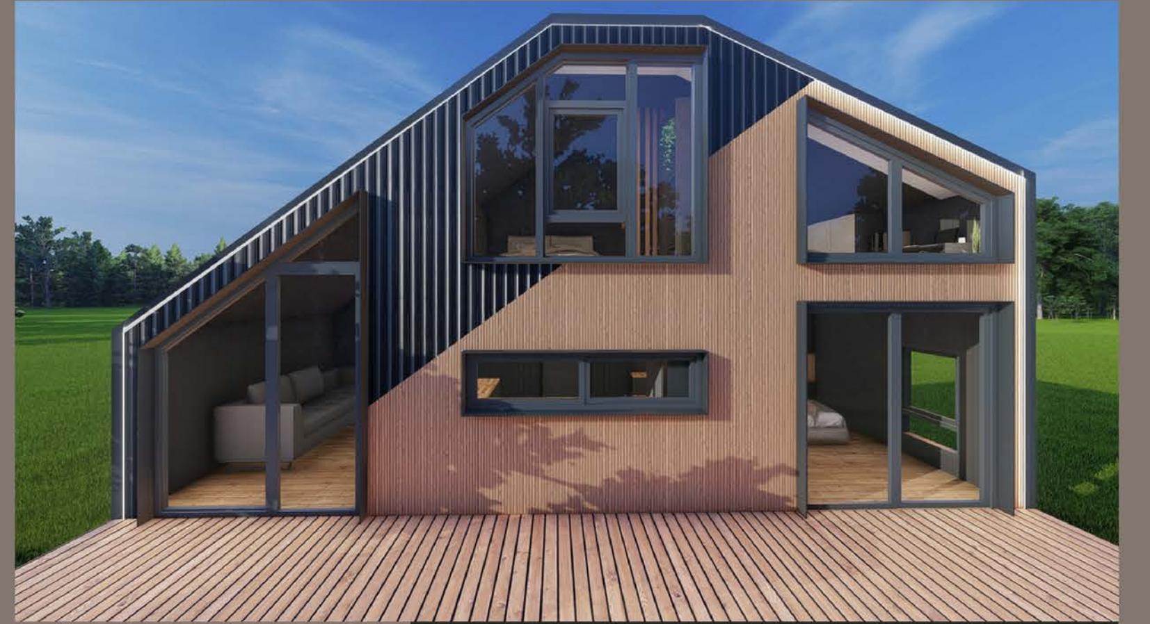
DIŞ MEKAN GÖRSELLERİ