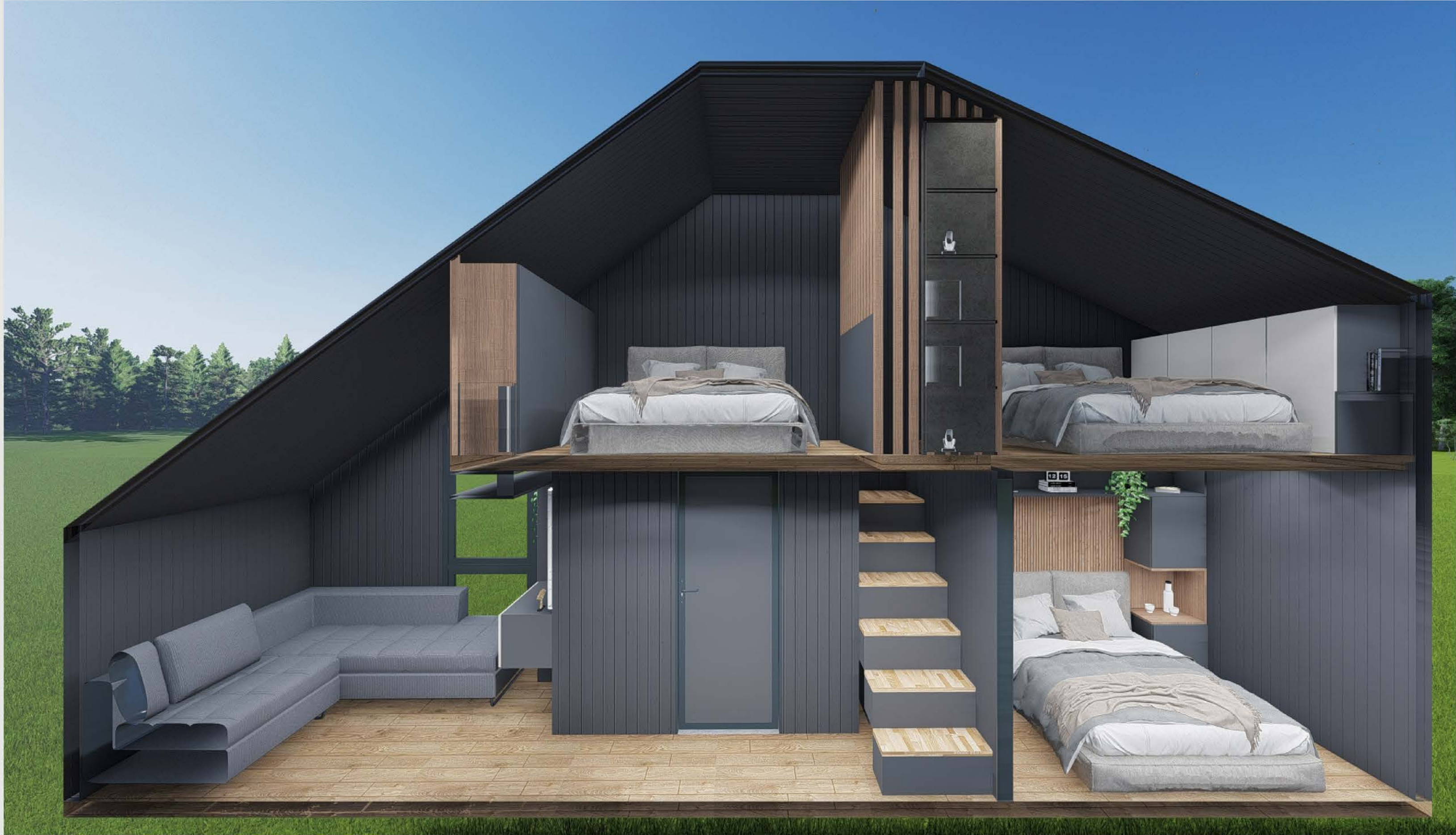
KESİT - 01